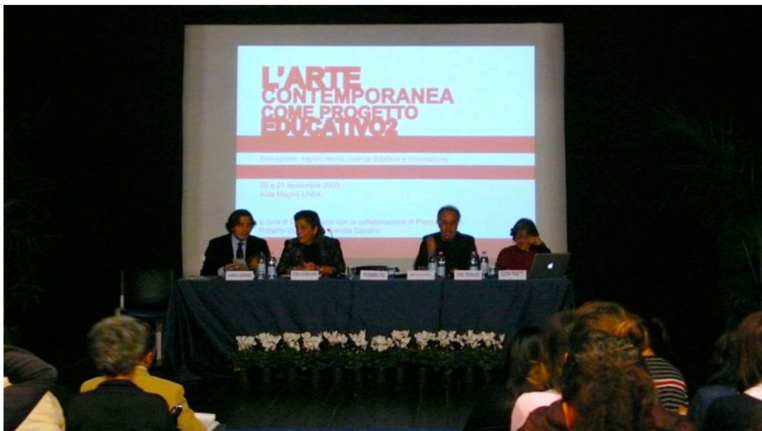
Introduzione al Convegno

I musei sono le istituzioni naturali dove si viene a contatto con il patrimonio artistico e sono i luoghi dove la fruizione dell'arte avviene attraverso una pratica laboratoriale cui si dedica sempre più attenzione. Il ruolo delle scuole in questo senso è primario, esse possono diventare luoghi di costante elaborazione di temi cruciali dell'attualità in cui l'arte può essere legata sempre di più alla formazione e alla ricerca didattica, nutrendosi di una situazione di aderenza e di osmosi rispetto alla cultura e al carattere del contesto in cui si forma.