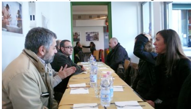
Momenti di pausa del Convegno.