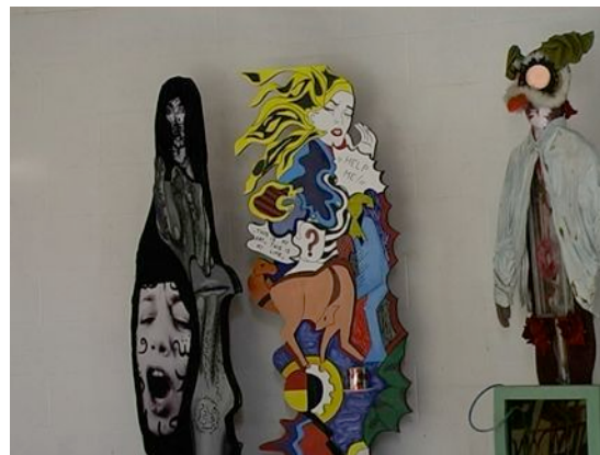
Workshop Memories and Encounters , manufatti degli studenti dei Licei Artistici Statali Boccioni e Brera (MI)