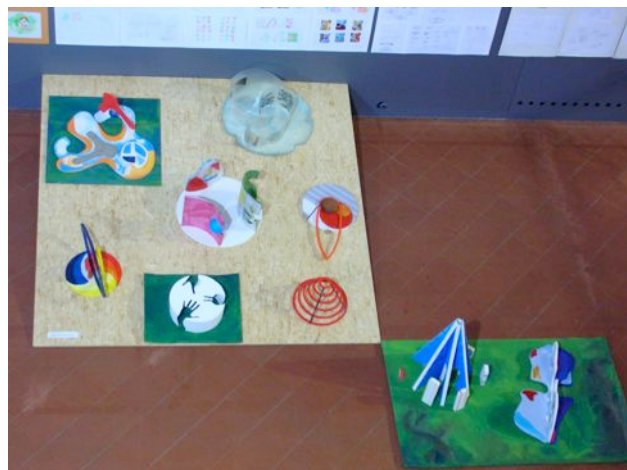
Particolari dei progetti cartacei e dei manufatti