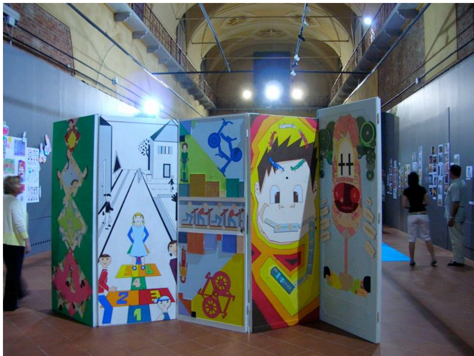
Progetto di porte per l'arredo di una Scuola primaria