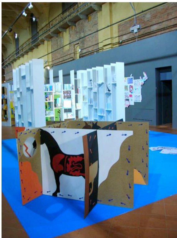
La grande struttura della biblioteca elementare