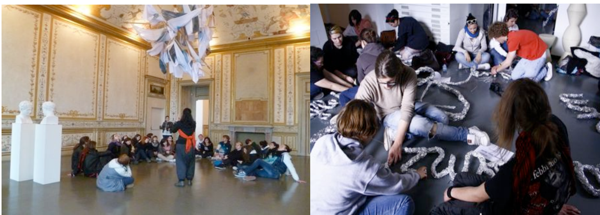
In una delle sale del Museo del Castello di Rivoli (TO) e i Laboratori con il Dipartimento educativo