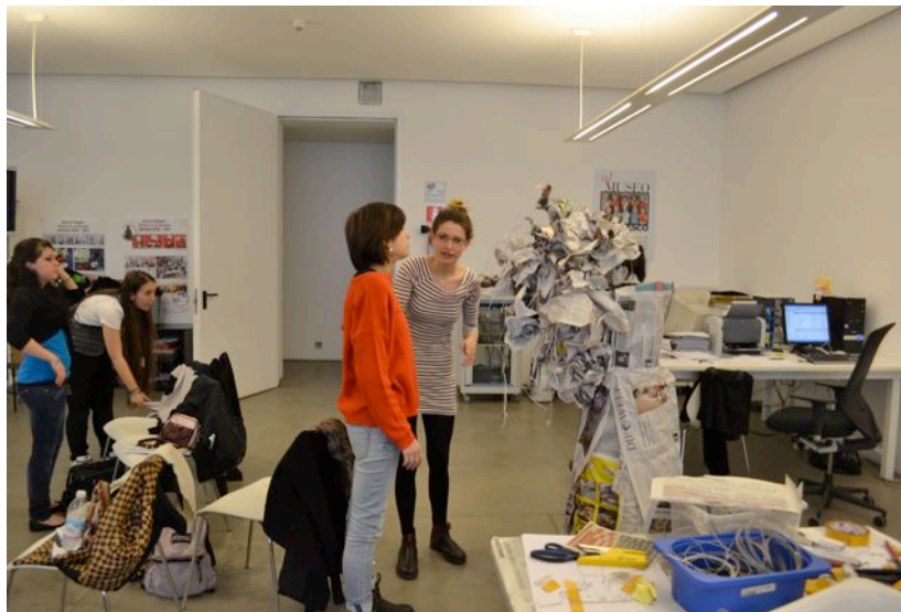
Incontri, laboratori e visite guidate con il personale del Dipartimento educativo della Fondazione Sandretto Re Rebaudengo di Torino